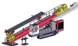
Съемный гусеничный движитель RP-C

Буровая установка PD 350/120 RP оснащена дизельным двигателем 470 кВт. Данную установку можно получить с гусеничным движителем, прицепом и рамной конструкцией. Дизельный двигатель, включая гидравлическую систему, могут быть пристроены к буровой установке PD 350/120 RP-C „on Board“, или добавлены как прицеп и рамная конструкция с отдельным Power Pack (20 фут. контейнер). У клиента есть так же возможность выбора отдельного Power Pack в 330 кВт, 470 кВт или 570 кВт. Благодаря высокому крутящему моменту и силе отвода буровая скважина может быть длиной более 2.600 м, а диаметр до 1.600 мм.