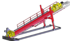
Стальной каркас RP-F